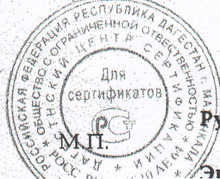
Схема сертификации: 2